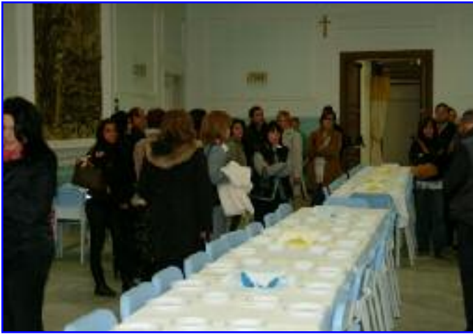
Un gruppo di genitori in visita al refettorio già pronto per accogliere gli alunni del primo turno, quello della scuola primaria alle 12,30. A seguire ci saranno altri due turni con gli studenti della scuola media.