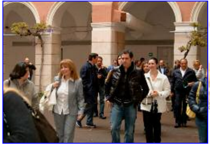
Dal refettorio si attraversa il cortile interno (sopra) per poi scendere in palestra (sotto a sinistra) e risalire nel giardino, ricco di alberi di varie specie, dotato di giochi e spazi aperti per la ricreazione.