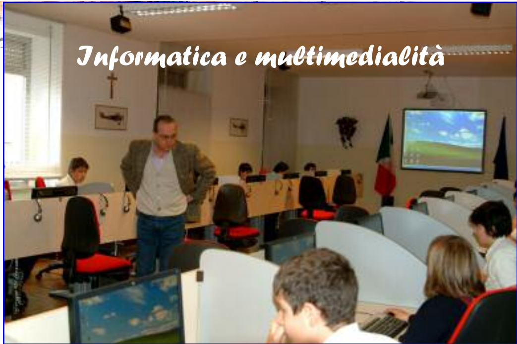
Sopra, la sala informatica durante una lezione con una classe di scuola media; sotto a sinistra l'aula informatica della scuola primaria; in basso una delle due sale multimediali con la L.I.M.

Dotata di 25 postazioni collegate in rete e gestite dal computer principale dell'insegnante, la Sala multimediale della scuola media dispone anche di una meravigliosa lavagna interattiva multimediale (L.I.M.), sulla quale si lavora a mano per mezzo di un "gessetto" speciale, come speciale è il cancellino. La lavagna è controllata e gestita da un computer a disposizione del docente. Si tratta di tecnologia all'avanguardia, che permette di svolgere moltissime attività didattiche e di qualsiasi disciplina, ma soprattutto permette collegamenti in tempo reale attraverso videoconferenze con scuole, classi e insegnanti di altri paesi: uno strumento eccezionale per