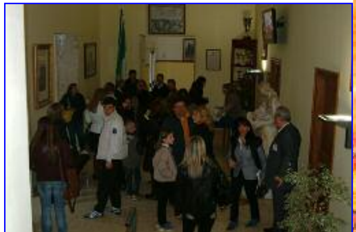
Lezione di geometria con l'ausilio del computer e dello schermo in una classe di I media. Sopra, genitori nell'atrio al termine della visita.