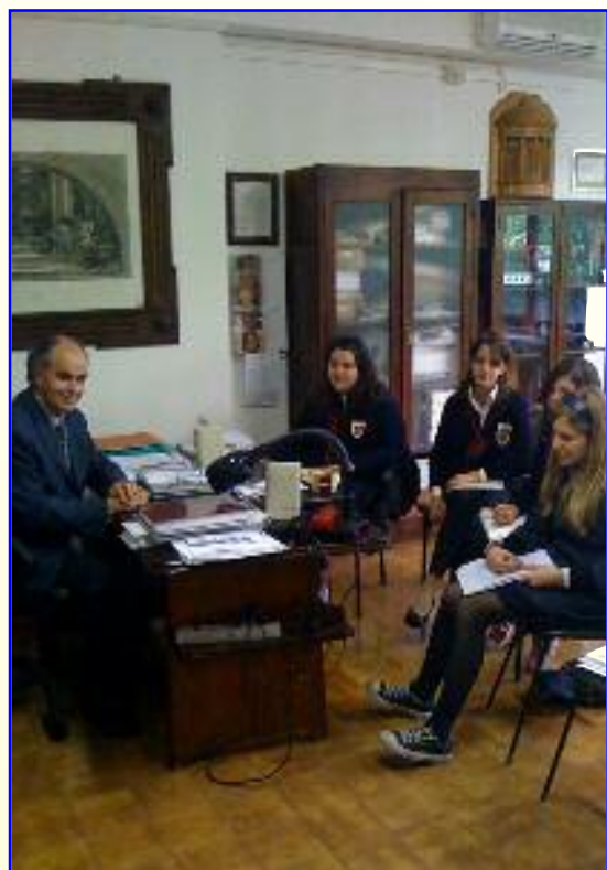
Il Preside intervistato nel suo ufficio

tuato denota come dicevo prima la non conoscenza dei programmi e dello svolgimento logico delle materie. Per pensare la diminuzione delle ore di storia e geo-