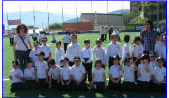
Manifestazione dei Giochi sportivi a Campo Ripoli. Gli alunni hanno effettuato percorsi, staffette, corse veloci, giochi di coordinazione. Hanno partecipato alla giornata sportiva tutte le classi della primaria accompagnate dalle maestre e dagli Educatori.