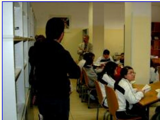
L'angolo del ristoro con la presenza del personale Ata; accanto i genitori nella Galleria degli artisti; sopra la nuova Biblioteca del Convitto