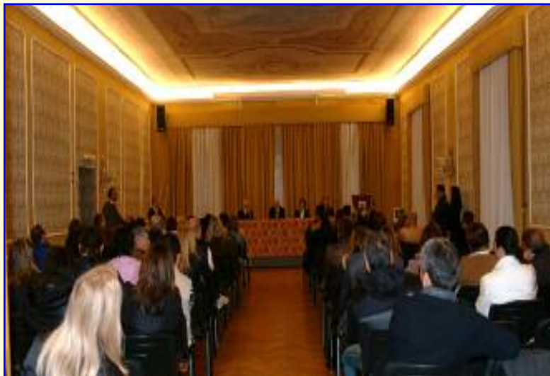
Due momenti della conferenza d'apertura tenuta dal Rettore nell'Aula Magna

noscono, ma di farla vedere in piena attività, per poter mostrare loro quegli aspetti della nostra giornata che non conoscono. La nostra emozione