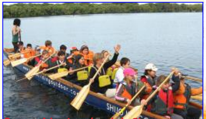
Classe VA, Campo scuola al Parco Nazionale del Circeo