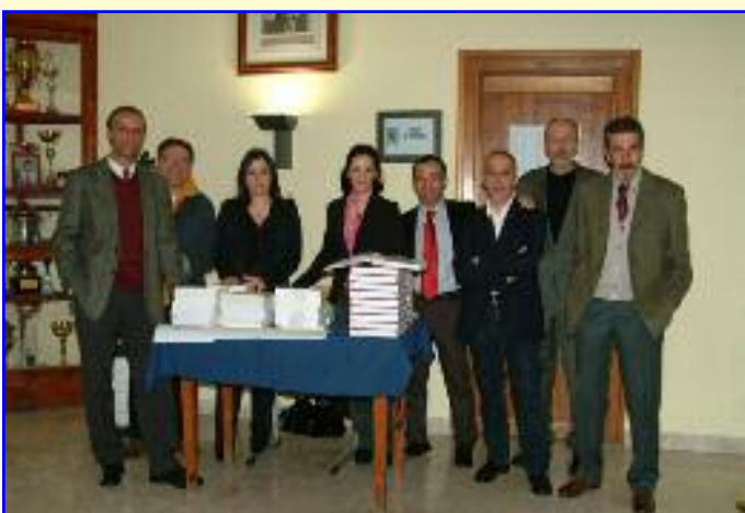
L'accoglienza degli Educatori nell'atrio del Convitto. Disponibili ed efficienti hanno accolto le famiglie e le hanno guidate nella visita. Sul tavolo varie pubblicazioni, tra cui il libro Convitto Nazionale Amedeo di Savoia - La Storia - pubblicato lo scorso anno in occasione del 120° anniversario della fondazione.

E' stata sicuramente una esperienza speciale per tutti, alunni e famiglie, perché in genere i genitori vedono solo dai diari e dalle pagelle cosa accade a scuola, mentre almeno per un giorno, il Convitto ha messo tutti insieme.